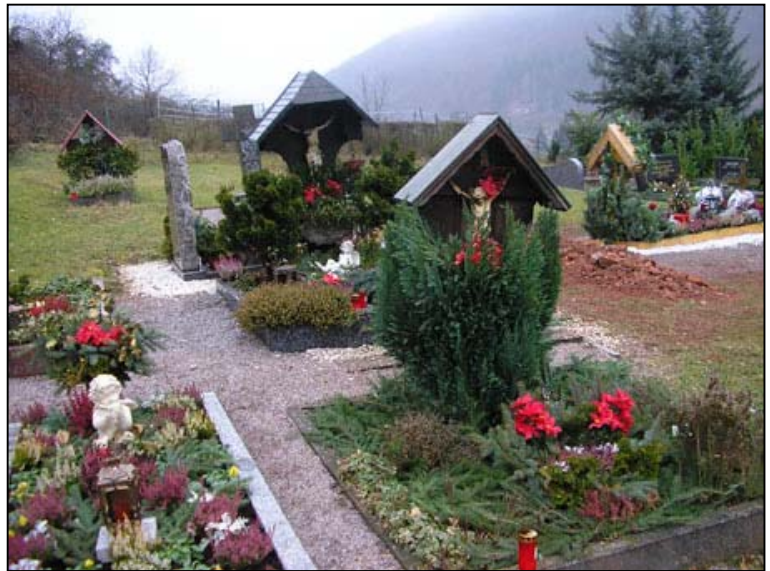
Sinti-Gräber in Eußerthal

Die aus der Deportation nach 1951 Eußerthal zurückgekehrten drei Sinti-Familien sind am Ort durchaus nicht als ehemalige Mitbürger willkommen geheißen worden. Der damalige Eußerthaler Bürgermeister soll versucht haben, die Niederlassung zu verhindern. Der Bezirksfürsorgeverband Bergzabern beschaffte den Familien Wohnwagen, die die Sinti im Staatswald aufstellen konnten. 1953 baute die Behörde einige Baracken hinzu und 1957 bekam eine der Familien ein „Einfachsthaus“.