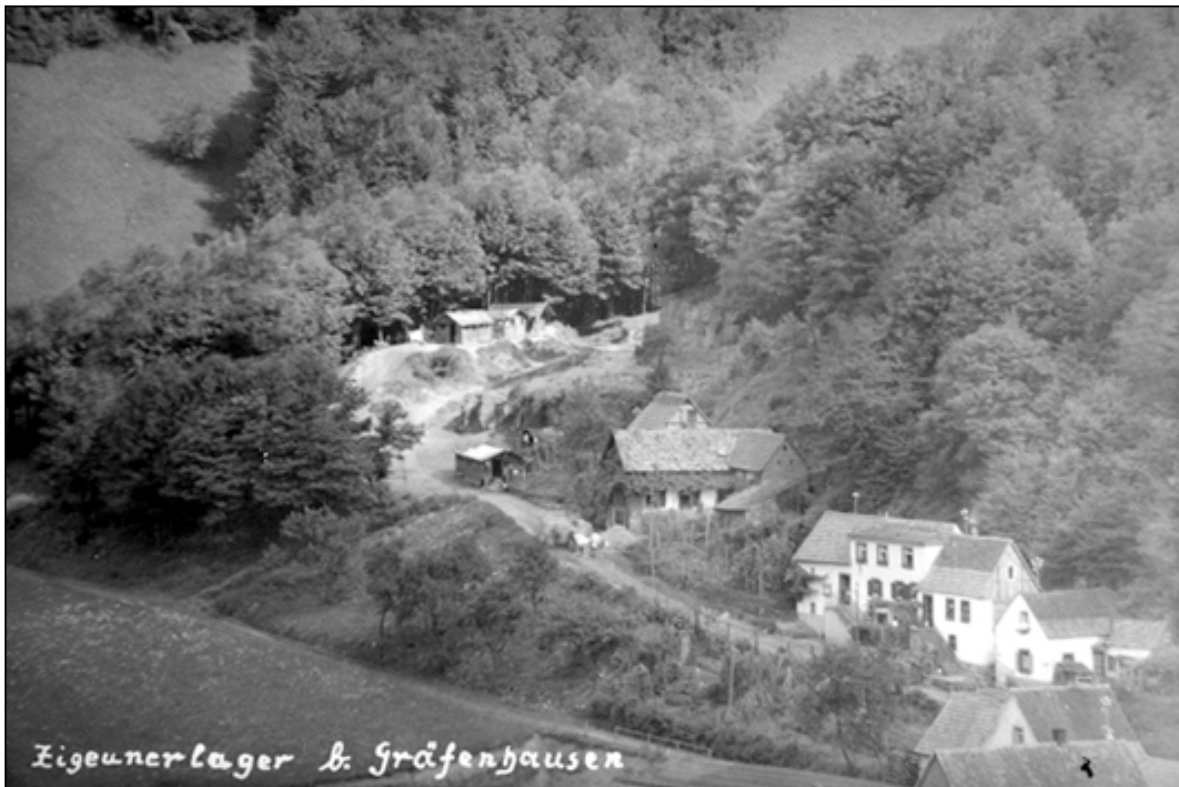
Die Hütten der Sinti am oberen Dorfende („Ritsch“) von Gräfenhausen (Vorkriegsaufnahme)

Bei der Volkszählung von 1925 sollen in Gräfenhausen allein 98 Zigeuner (vermutlich alleamt Sinti) gelebt haben (ARNOLD 1960). Die meisten oder alle noch verbliebenen Sinti der beiden Orte – 1938 waren bereits einige Männer zur Zwangsarbeit ins KZ Dachau verbracht worden – sind im Mai 1940 nach Polen deportiert worden (über die Verfolgung der dortigen Sinti siehe RENNER 1988a und 1995, S.222-224; BOUQUET 1983; DELFELD 2000, S.280-283). Von denen, die die NS-Zeit überlebt haben, sind nur wenige zurück nach Gräfenhausen gekommen. Die es dennoch getan haben, so erfährt man im Ort, haben an ihrer Heimat gehangen und sind auch später nicht freiwillig von dort weggezogen.