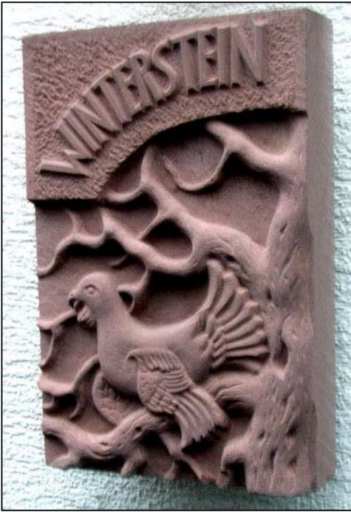
Relief am Haus eines der Bildhauer in Albersweiler