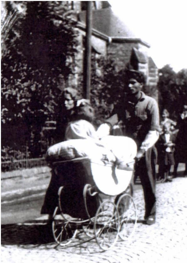
„Backesnelly“ mit Ehemann und Kindern im Jahr 1935 unterwegs in Herdorf

Die „Backesnelly“ hat es sogar so weit gebracht, dass ihr Name Eingang in den Sprachschatz des Daadener Landes gefunden hat, denn wenn sich heute eine weibliche Person unvoreilhaft gekleidet hat, sagt man: „Dau säust aus wie det Backesnelly“.